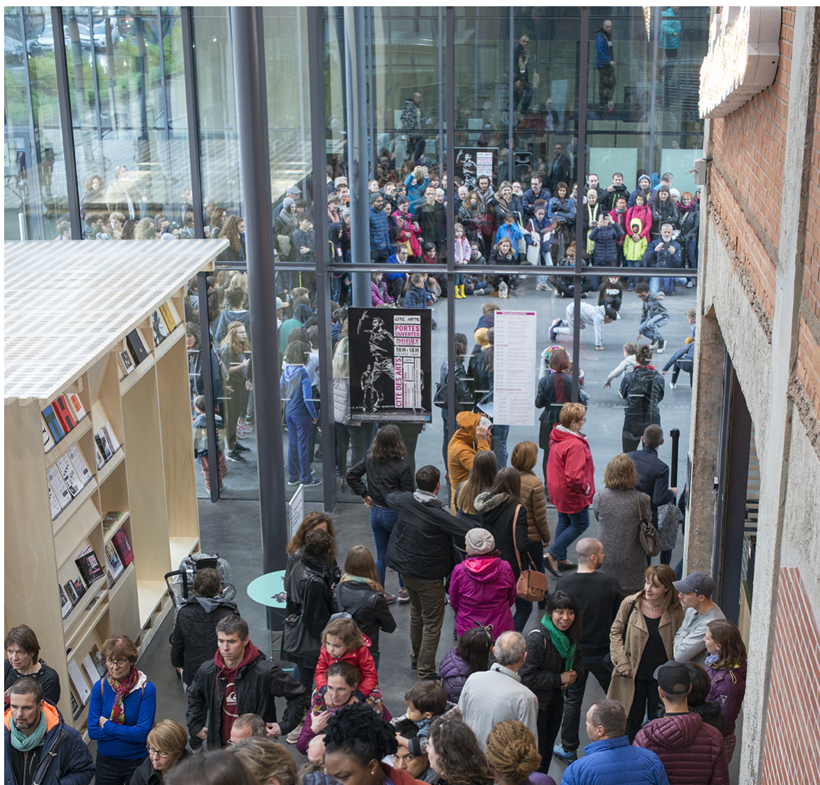
Portes ouvertes de la Cité des Arts, Besançon