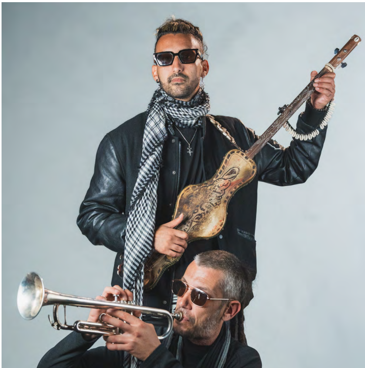
Elements of Baraka.

Situé au cœur de la Cité des Arts, dans le centre historique de Besançon, Le Bastion est un lieu dédié aux musiques actuelles, animé par une association engagée pour l'intérêt général. Il accompagne depuis 40 ans les artistes de tous horizons en proposant des espaces de répétition et d'enregistrement, des projets de diffusion et de transmission, ainsi que des temps forts comme le Biergarten ou Musiciennes à Besançon .