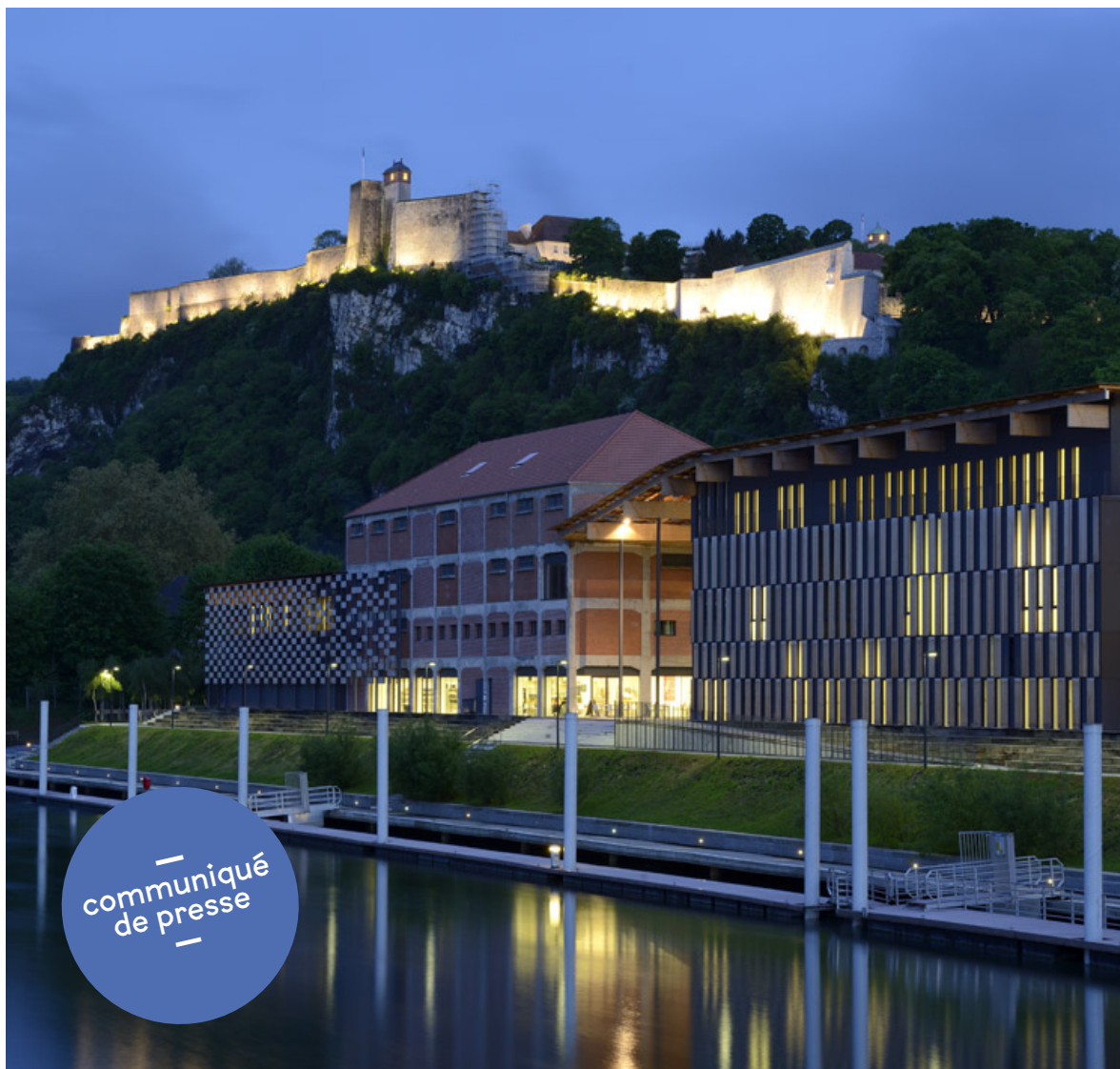
Cité des Arts, Besançon © Kengo Kuma & Associates / Archidev. Photo : Nicolas Waltefaugle

La Cité des Arts de Besançon inaugure la première édition d'un nouveau temps fort partagé entre le Conservatoire à Rayonnement Régional du Grand Besançon Métropole, le Frac Franche-Comté, Le Bastion et Le Pixel - Taqueria Quest.