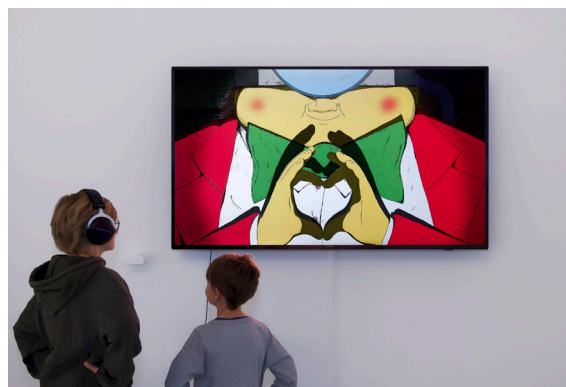
Hippolyte Cupillard, La séance , 2021. © Hippolyte Cupillard.

La collection, conservée dans les vastes réserves du Frac, est riche de plus de 700 œuvres d'artistes français et étrangers. Cette collection illustre la richesse de la création actuelle et la diversité des formes de l'art contemporain : peintures, sculptures, dessins, photographies, vidéos, installations, performances... et s'inscrit en résonance avec le passé horloger franc-comtois en questionnant la notion de temps. Elle s'enrichit chaque année de nouvelles acquisitions, sélectionnées par un collège d'experts qui veillent à ce qu'y soient représentées les notions de temporalité et de transdisciplinarité, notamment à travers des œuvres sonores ou dialoguant avec le spectacle vivant.