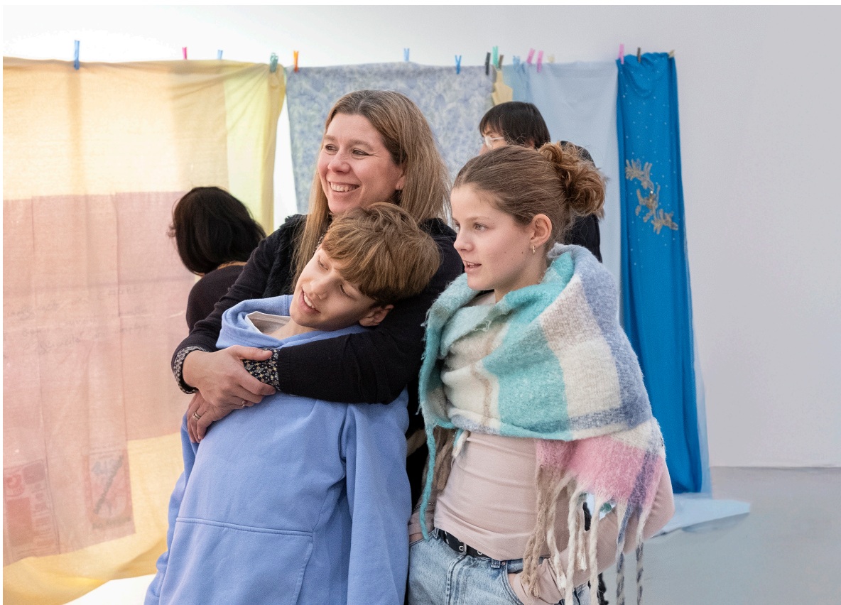
Visite-atelier parents-enfants

S'adressant au jeune public, le livret-jeux vous accompagne pendant votre visite du Frac. Demandez-le à l'accueil et prolongez votre expérience autour de l'art contemporain même à la maison !