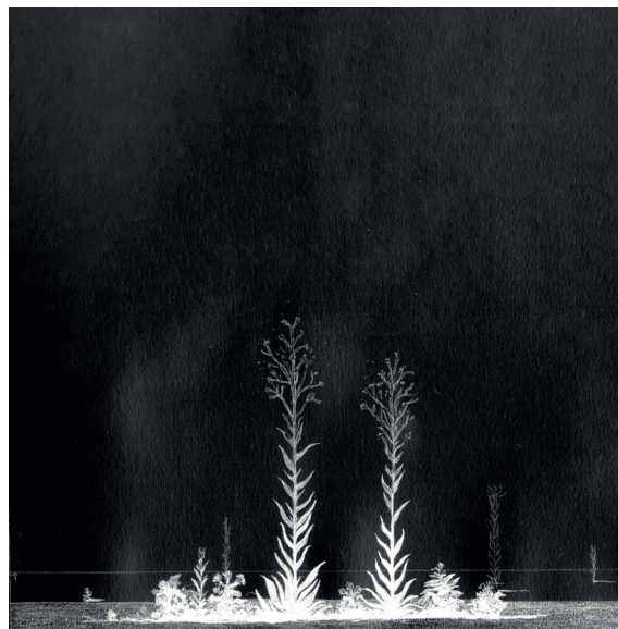
Hippolyte Cupillard, Rudérales (dessin préparatoire), 2024. © Hippolyte Cupillard

La collection, conservée dans les vastes réserves du Frac, est riche de plus de 800 œuvres d'artistes français et étrangers. Cette collection illustre la richesse de la création actuelle et la diversité des formes de l'art contemporain : peintures, sculptures, dessins, photographies, vidéos, installations, performances... et s'inscrit en résonance avec le passé horloger franc-comtois en questionnant la notion de temps. Elle s'enrichit chaque année de nouvelles acquisitions, sélectionnées par un collège d'experts qui veillent à ce qu'y soient représentées les notions de temporalité et de transdisciplinarité, notamment à travers des œuvres sonores ou dialoguant avec le spectacle vivant.