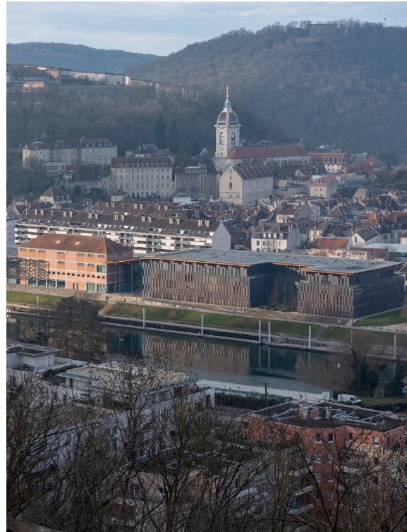
Frac Franche-Comté, Cité des arts, Besançon © Kengo Kuma & Associates / Archidev.

Faustine Labeuche +33(0)3 81 87 87 50 presse@frac-franche-comte.fr