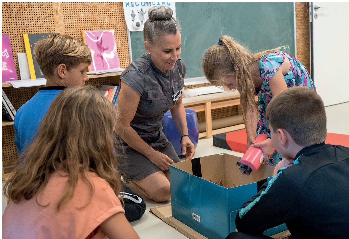
Atelier 7-10 ans