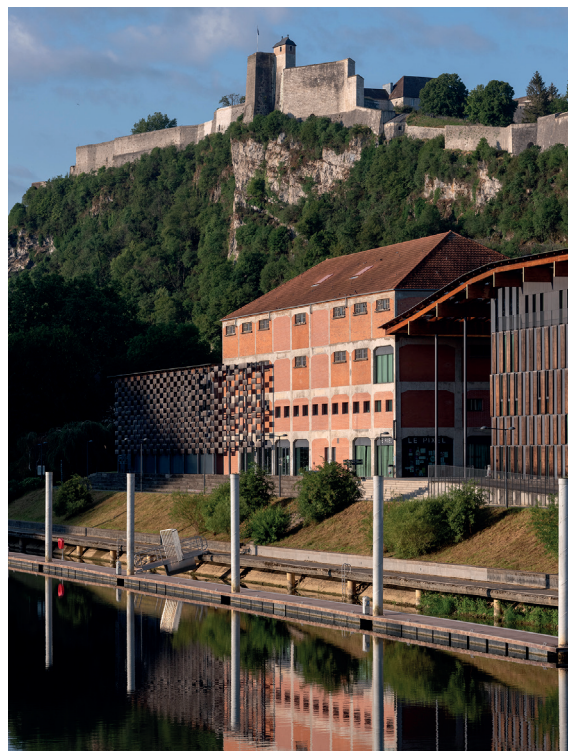
Frac Franche-Comté, Cité des arts, Besançon © Kengo Kuma & Associates / Archidev. Photo : Nicolas Waltefaugle

Presse régionale / Frac Franche-Comté Faustine Labeuche +33(0)3 81 87 87 50 presse@frac-franche-comte.fr