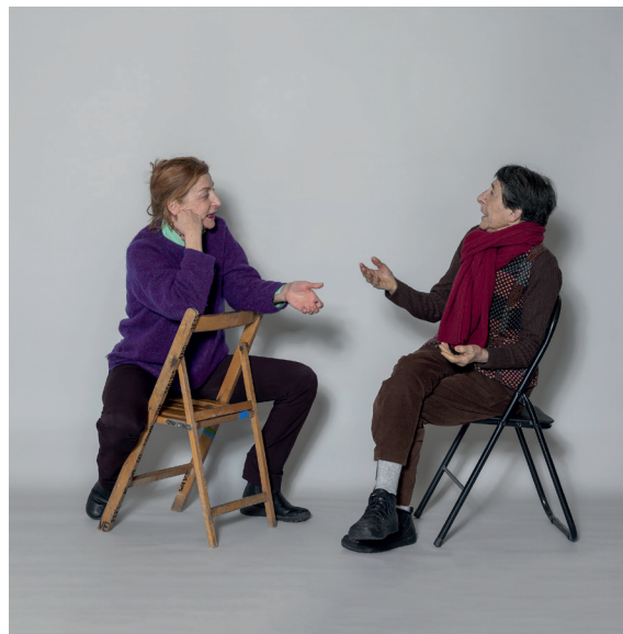
La Ribot et Esther Ferrer, 2024.

La collection, conservée dans les vastes réserves du Frac, est riche de plus de 700 œuvres d'artistes français et étrangers. Cette collection illustre la richesse de la création actuelle et la diversité des formes de l'art contemporain : peintures, sculptures, dessins, photographies, vidéos, installations, performances... et s'inscrit en résonance avec le passé horloger franc-comtois en questionnant la notion de temps. Elle s'enrichit chaque année de nouvelles acquisitions, sélectionnées par un collège d'experts qui veillent à ce qu'y soient représentées les notions de temporalité et de transdisciplinarité, notamment à travers des œuvres sonores ou dialoguant avec le spectacle vivant.