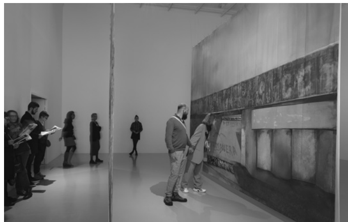
Lawrence Abu Hamdan, 45 th Parallel , 2022. Courtesy de l'artiste et mor charpentier. Vue de l'exposition au Centre d'art contemporain Mercer Union, Toronto, 2022. © Lawrence Abu Hamdan. Photo: Toni Hafkensc

Courtesy de l'artiste et mor charpentier