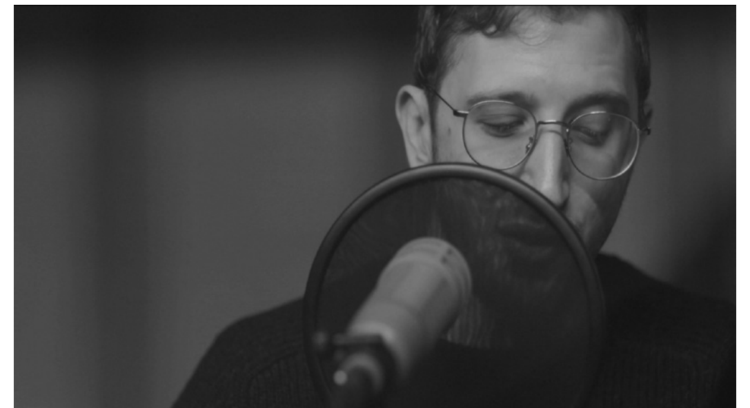
Lawrence Abu Hamdan, Walled-unwalled , 2018.

Earwitness Inventory , After SFX et Walled-unwalled constituent un ensemble d'œuvres dérivées de l'enquête menée par l'artiste en 2016 sur la prison de Saydnaya en Syrie.