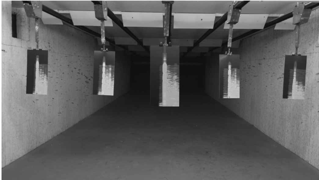
Lawrence Abu Hamdan, Rubber coated steel , 2016. Courtesy de l'artiste et mor charpentier © Lawrence Abu Hamdan

Courtesy de l'artiste et mor charpentier