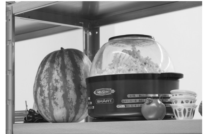
Lawrence Abu Hamdan, Earwitness inventory , 2018. Collection Frac Franche-Comté. Vue de l'exposition au Contemporary Art Museum S' Louis, 2019 © Lawrence Abu Hamdan. Photo: Dusty Kessler

Cette installation a été commissionnée et produite par Chisenhale Gallery, Londres, en partenariat avec: Witte de With Center for Contemporary Art, Rotterdam; Contemporary Art Museum, S' Louis et Institute of Modern Art, Brisbane. Elle a été exposée dans ces différents lieux entre 2018 et 2019.