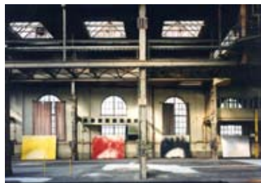
Vier Farb-Korridore Smart, 1998. Quatre couloirs de peinture (Smart)