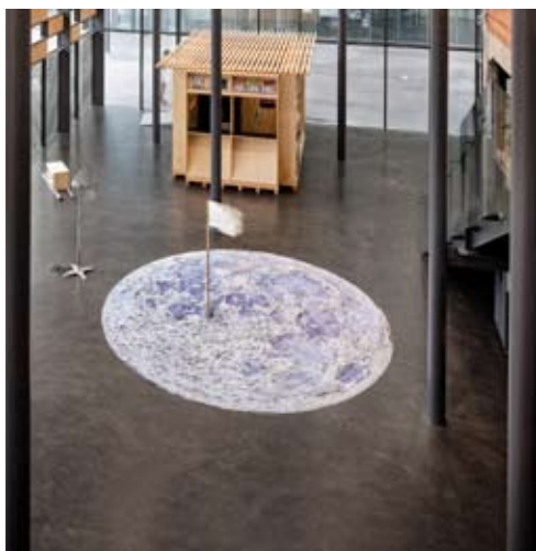
Mond, 2021 Lune