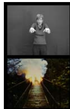
Feuer (Brücke), 1981 Feu (Pont)