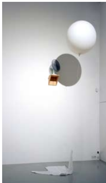
Hemd, 2003 Chemise