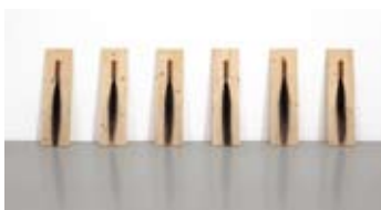
Raketen auf Holzbrettern, 2020 Fusées sur planches de bois