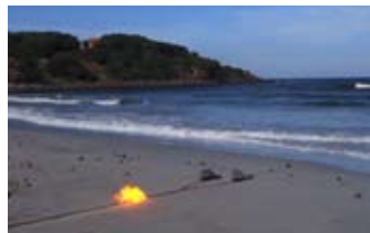
Un passo verso il mare, 2016 (0°52'``) MAN Nuoro/Sardaigne