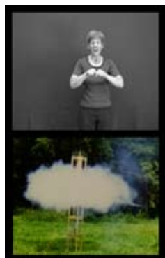
Tischchen, 1980 Petite table