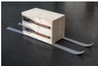
Ski mit Raketen, 2020 Skis avec fusées