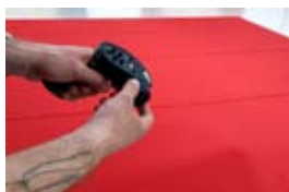
Tuch, 2016 Tissu