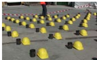
Aktion anlässlich des Gotthard-Basistunnel-Durchstichs, 2010 (3°53'``)

Images extraites d'une sélection de vidéos réalisées par : Aleksandra Signer, Barbara Signer, Tomasz Rogowiec, Dominique Müller, montrant des actions de Roman Signer allant de 2008 à 2019.