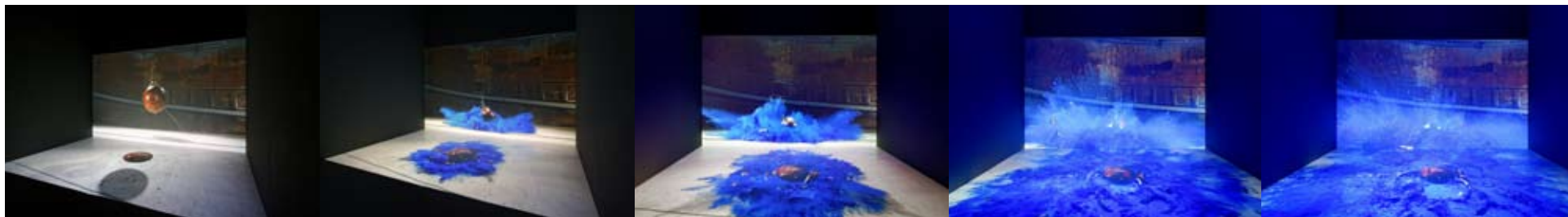
Kugel mit blauer Farbe , 2012 -Video: Tomasz Rogowiec, Aleksandra Signer Boule avec peinture bleue