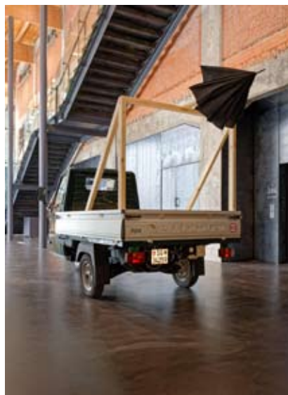
Piaggio mit Schirm, 2022 Piaggio avec parapluie