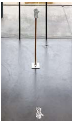
Hand, 2021 Main