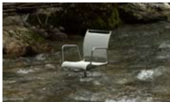
Bürostuhl, 2010 Weissbad (1°53'``) Chaise de bureau