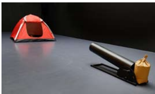
Fussballkanone , 2015 Canon-football