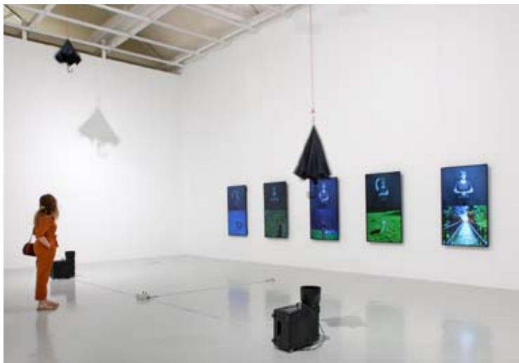
Installation mit zwei Regenschirmen, 2020 Installation avec deux parapluies

Les sculptures-actions portent une charge monumentale et dérisoire, à la fois ironique et mélancolique.