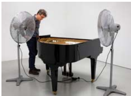
Klavier, 2010. Piano