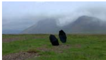
Zwei Schirme, 2009. Islande (2°00'``) Deux parapluies