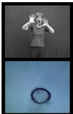
Rauchring, 1983 Anneau de fumée