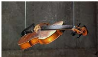
Sandmusik, 2008 Atelier St. Gallen Video : Aleksandra Signer (1'14'') Musique de sable