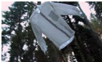
Hemd, 2009 (1°02'``) Chemise

Images extraites d'une sélection de vidéos réalisées par : Aleksandra Signer, Barbara Signer, Tomasz Rogowiec, Dominique Müller, montrant des actions de Roman Signer allant de 2008 à 2019.