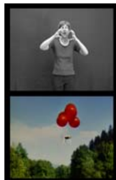
Tisch/Weissbad, 1985 Table (Weissbad)