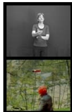
Wettlauf mit Rakete, 1981 Course avec fusée