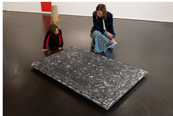
À vous d'enquêter ! Le secret de la collection . Photo : Blaise Adilon