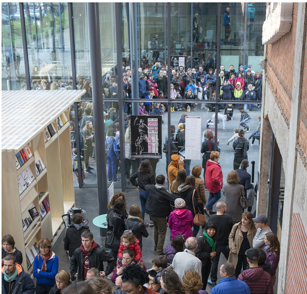
Portes ouvertes de la Cité des Arts, Besançon