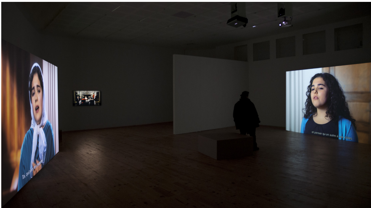
Nina Laisné, Esas lágrimas son pocas , 2015. Installation vidéo, double projection face à face, 12 min. © Nina Laisné