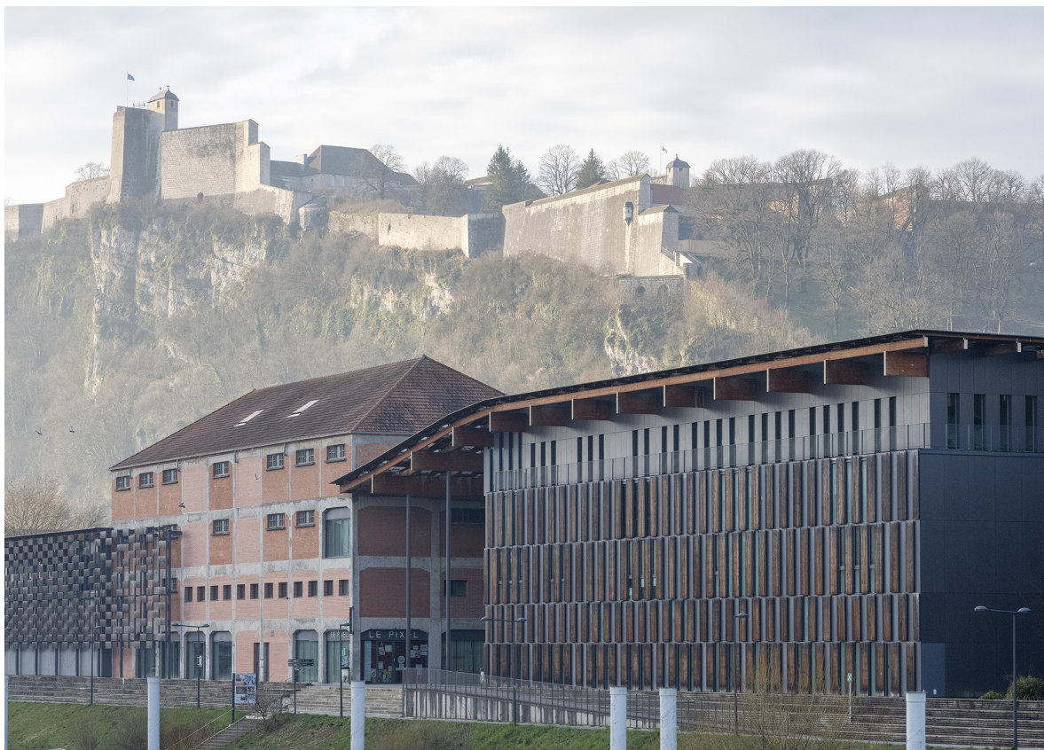
Frac Franche-Comté, Cité des Arts, Besançon © Kengo Kuma & Associates / Archidev. Photo : Nicolas Waltefaugle

Autres conditions tarifaires disponibles à l'accueil.