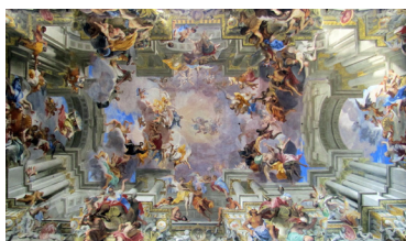
L'Apothéose de Saint Ignace, par Andrea Pozzo